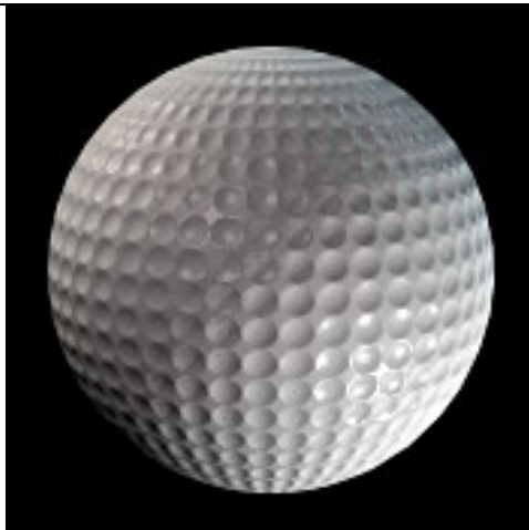
industrie du loisir (balle de golf)